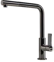
Monomando Omega Plus Gun Metal