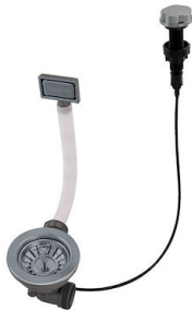
Desagüe automático Gun metal - PG